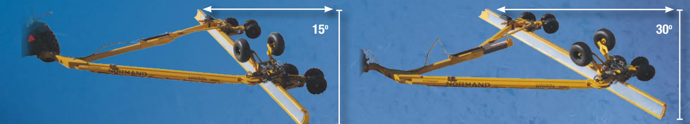
Variation du niveau