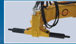
Barre d'attache pivotante sur 2 axes