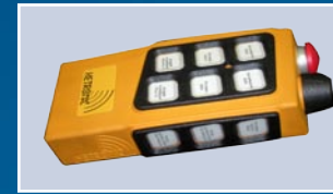
Contrôle sans fil à radio fréquences